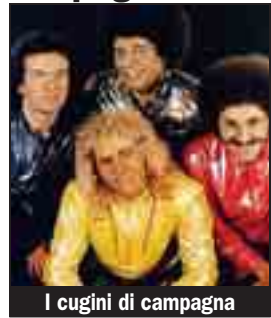
I cugini di campagna

MONTORFANO Sono balzati al successo all'inizio degli anni '70 con la celeberrima canzone Anima Mia , ma nella loro lunga carriera artistica hanno incassato decine di grandi successi. Sono i Cugini di Campagna, lo storico gruppo musicale che si esibirà giovedì alle 15.30, al Lido di Montorfano, nell'ambito della tradizionale «Fiera degli Uccelli».