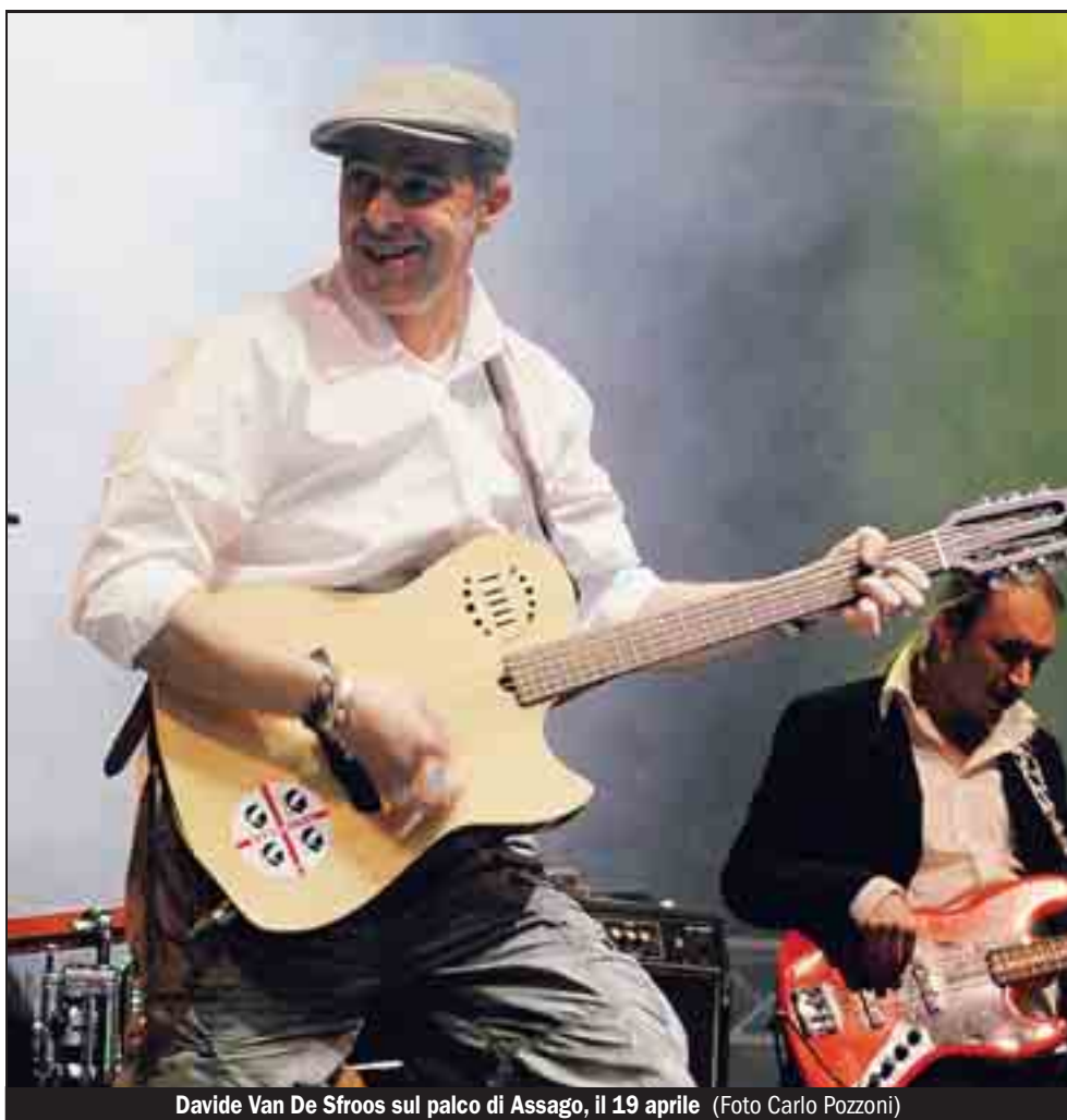
Davide Van De Sfroos sul palco di Assago, il 19 aprile